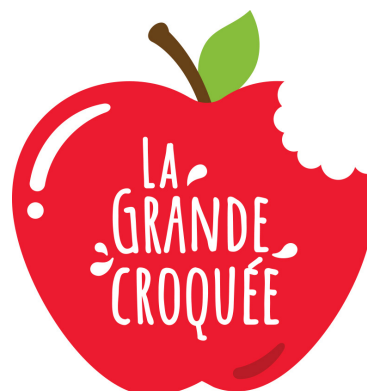
Logo en français